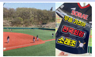
제37회 협회장기 준우승