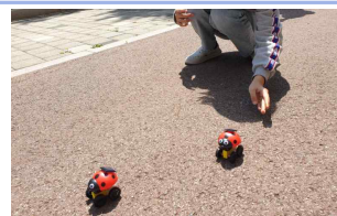
과학의날행사 태양광 무동발레(6학년)