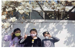
학교돌 봄꽃 관찰(2학년)