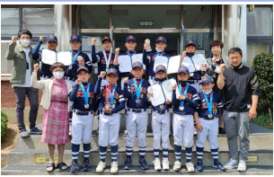
제37회 협회장기 겸 전국소년체육대회 준우승(야구부)