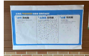
학생자치회 이름 투표

소래초 학생자치회 주관으로 '학생자치회 이름 공모전'을 실시 하였습니다. 최종 3개 안을 선정하여 스티커로 투표를 한 결과 '소래꿈 자치회' 소중한 미래를 꿈꾸는 학생자치회'로 결정이 되었습니다.(대상 수상: 5학년 1반 김○윤)