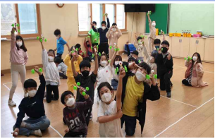
과학의날행사_자석 자동차 만들기(3학년)