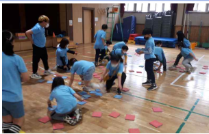
어린이날 기념 작은체육대회(4학년)