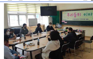
소래초 학부모회 회의(4.20.)

2022. 4. 20.(수) 10:00에 학부모회의실에 모여 2022년 학부모회 운영 계획에 대한 논의와 소래초 학부모 생활 협약을 정하는 회의를 진행하였습니다. 이어 학교 꽃밭에 꽃모종 400개를 심어 학교를 예쁘게 단장해 주었습니다.