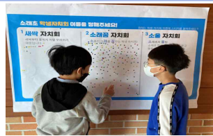
소래꿈 학생자치회 회의(4.7.(목))