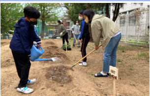
텃밭 가꾸기_모종심기(푸른반, 새솔반)