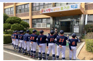
야구부 대회 출전 파이팅

아쉬움에 눈물을 흘리며 안타까움을 표했지만 우리 든든한 선수들 실망하지 않고 다음 대회 준비를 위해 더 열심히 훈련에 임하고 있습니다. 소래초 교육 가족 모두 한마음으로 다음 경기를 응원해 주시기 바랍니다.