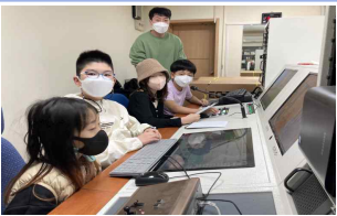
소래 방송부 활동(매주 화, 금 08:40~08:55 아침 방송)