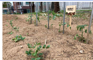
푸른반, 새솔반 텃밭 무럭무럭 자라라