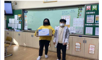
이름 공모전 대상 선물 증정