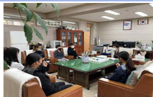
소래초 육상부 파이팅~!