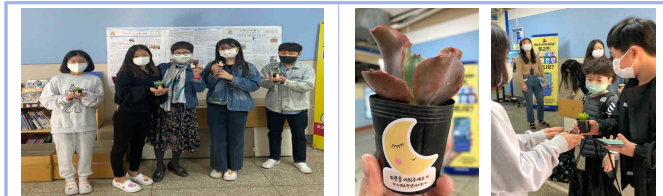
다육이 나누기 행사 준비(임원)

식목일을 맞아 4.8.(금) 08:20~09:00 아침 등굣길에 '소래꿈 자치회' 주관으로 전교생에게 다육이 나누어 주는 행사를 진행하였습니다. 다육이 이름 지어주기, '선인장 호텔' 그림책 독후활동, 글 쓰기 등 학급별 관련 활동을 하였습니다. 포켓몬을 좋아하는 2학년 친구는 '리자몽'이라 이름 지어주었다는데 잘 키우고 있겠지요?