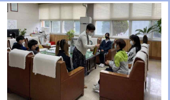
출전 선수 격려(교장실)